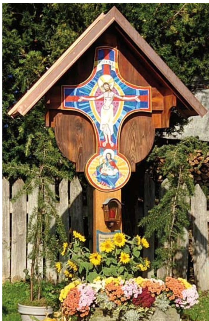
Sehr gelungen: das erneuerte Kreuz strahlt richtiggehend.