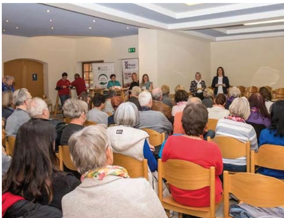
Der Pfarrsaal war gut besucht, viele Interessierte folgten den Ausführungen.