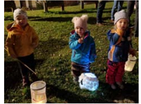
Zwergertreff beim Laternenfest (o.) und einem Zwergertreff mitten drin (u.).