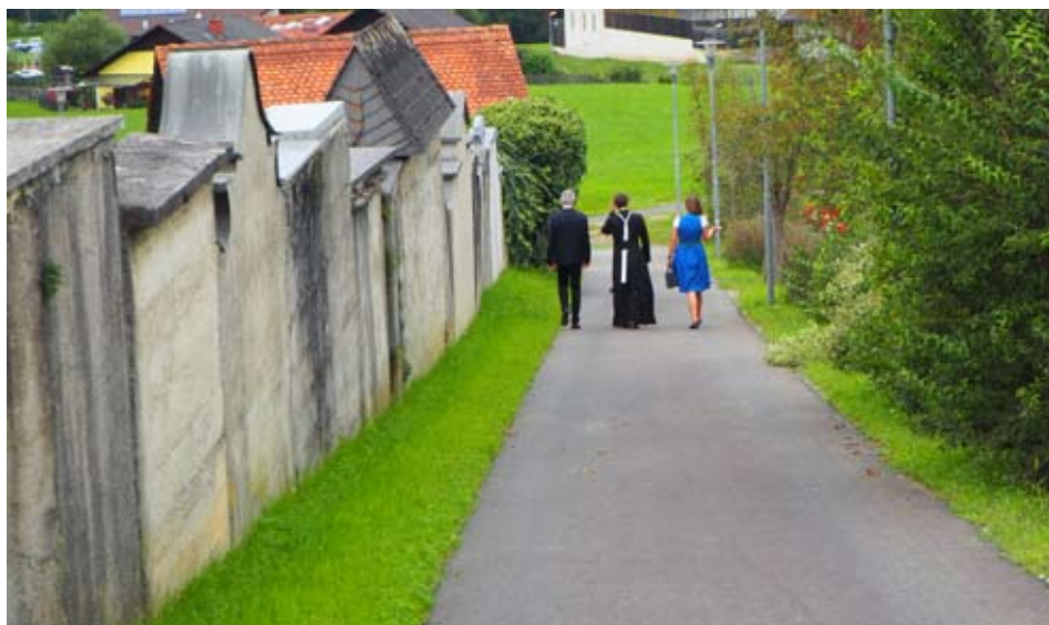
Der Friedhofsweg wurde in Zusammenarbeit mit der Gemeinde neu asphaltiert .