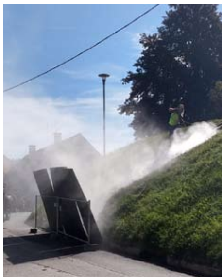
Die Stiege vom Pfarrhof zur Kirche kann nach der Sanierung wieder begangen werden.