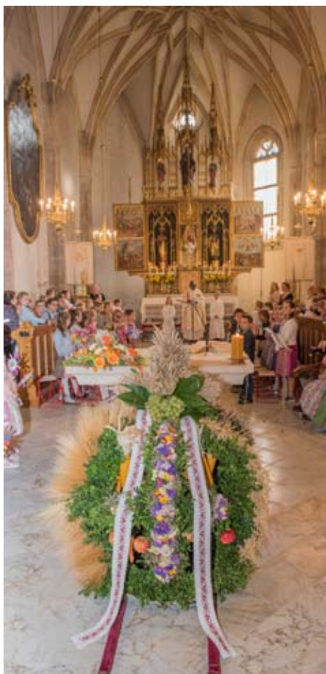
Unser Dank wird mit der Erntekrone symbolisch vor Gott gebracht.