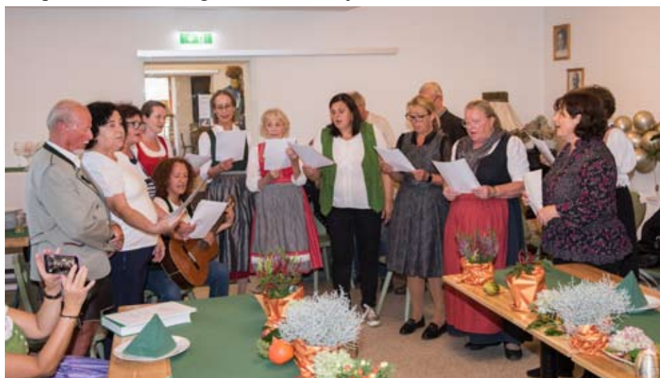
Musikalische Gratulation für die Chorleiterin und ihren Ehemann am 1. Oktober.