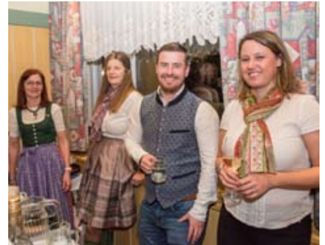
Die Pfarrgemeinderät*innen im Einsatz

Viele Besucher*innen haben fleißig das Tanzbein geschwungen.