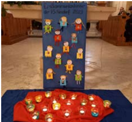
Die 13 Neudorfer Erstkommunionkinder

Nun freuen sie sich auf das Brotbacken, das natürlich vor der Erstkommunion nicht fehlen darf.