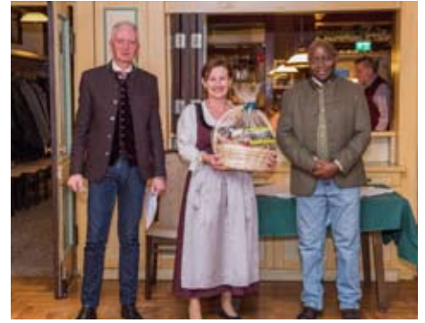
Gut geschätzt - und gewonnen!