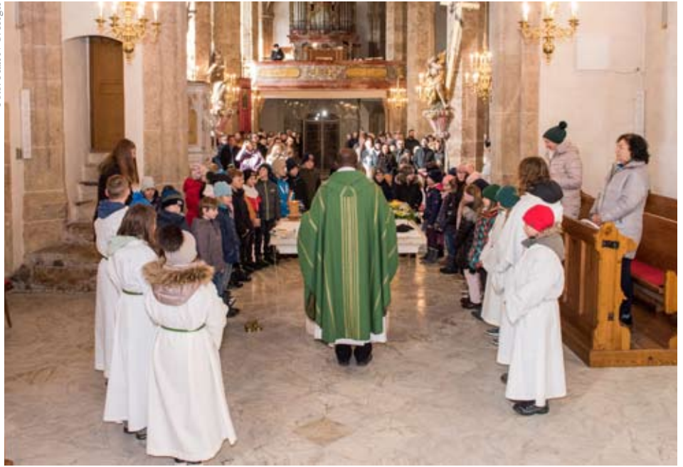
Feierlicher Vorstellungsgottesdienst der Erstkommunionkinder.

tig wie Brot für die Menschen ist. Eine bedeutende Rolle bei der Vorbereitung auf den Empfang des Sakraments spielen aber die Eltern: