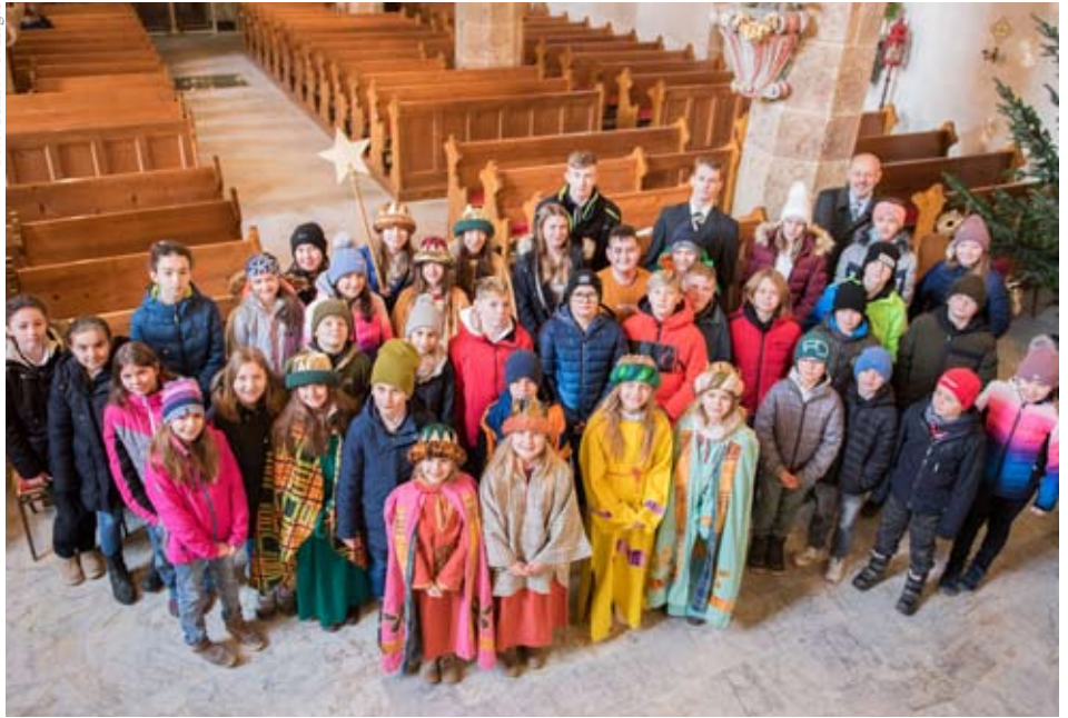
Viele unserer Sternsingerinnen und Sternsinger beim Gottesdienst am Dreikönigstag.

touren entschieden. Dank der guten Zusammenarbeit von Erwachsenen, Kindern und Jugendlichen ist auch in Neudorf alles glatt gegangen. Bei den Verantwortlichen der Pfarre